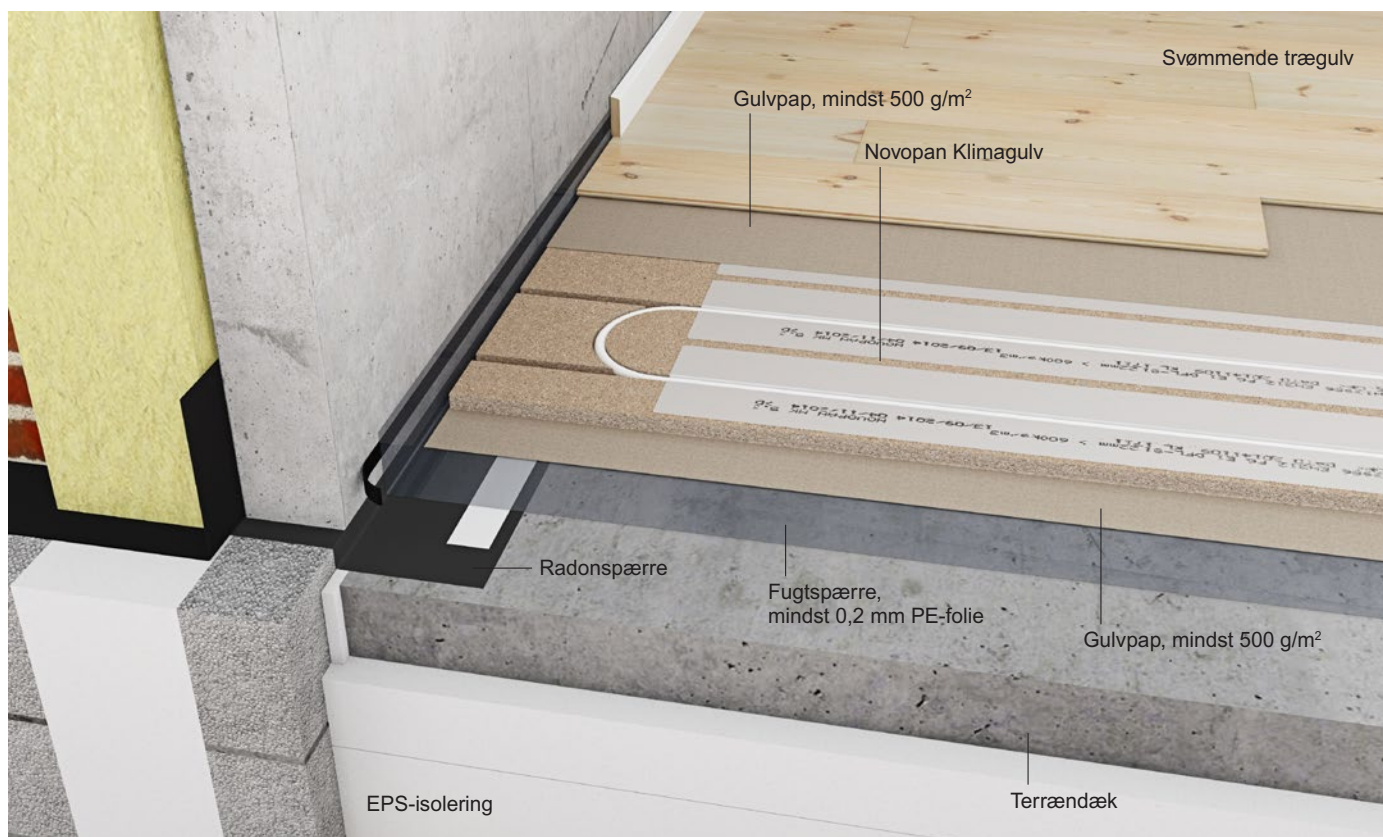
Figur 1 Novopan Klimagulv lagt svømmende på terrændæk og afsluttet med et svømmende trægulv – mindst 12 mm.

Anvendes der vendeplader som alternativ til fræsning af vendespor skal de lægges i henhold til monteringsanvisningerne Novopan vendeplader til 22 mm Klimagulv og Novopan vendeplader til 25 mm Klimagulv .